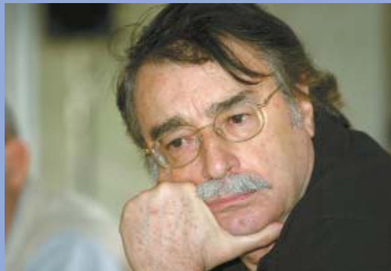
Ramonet: media concentration concerns

These complications are seen in a context in which the Forum is lagging behind on communication issues, evident in the difficulty it has in designating spokespersons and "producing news", he said.