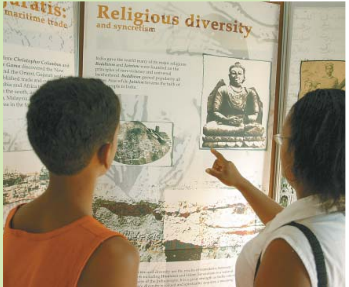
Southern partners: Mumbai and Porto Alegre united

"Every year we discuss and debate the same issues, but end up without any direction. What is perhaps very special is the process of sensitising people."