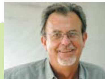
By Candido Grzybowski

O FSM inova ao sustentar a primazia da política na vida humana e não a dos mercados. Pó isso o Fórum é um processo e um espaço de inovação democrática que estimula os diferentes sujeitos sociais a participar e impor sua vontade sobre o poder estatal, as instituições multilaterais, as corporações e os mercados. Ao mesmo tempo o FSM precisa se alimentar mais e mais da for-