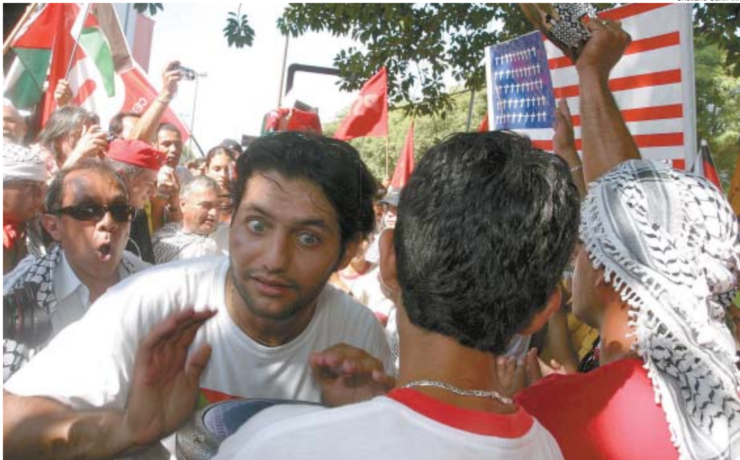
The issue of Palestine stirred strong feelings at the WSF yesterday