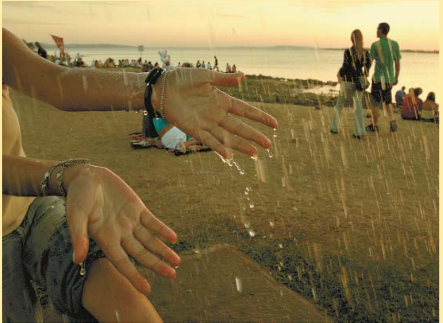
Water, water everywhere, but...

At the moment, the right to water is not legally binding, Fairstien noted, be-